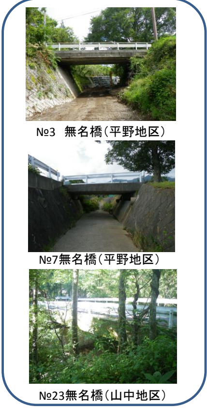
山中湖村橋梁長寿命化修繕事業