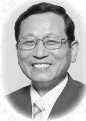
山中湖村長 高村 文教