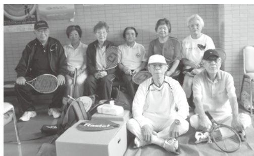
バウンドテニスの選手の皆さん