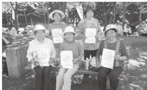
輪投げの選手の皆さん (第1位でした！)