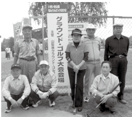
グラウンドゴルフの選手の皆さん

9月の終わりに県内の老人クラブが集まってスポーツ大会が開催されました。山中湖村は、グラウンドゴルフ、バウンドテニス、輪投げに出場しました。